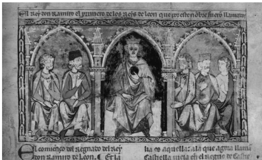
FIGURA 2 «Versión ampliada» de la Estoria de Espanna (Escorial, X.I.4, fol. 23 r ). Los cortesanos castellanos evocan el reinado de Ramiro I de Asturias (ca. 1288-1289).

Tal despersonalización de los encargos regios realizados en las dos primeras décadas del siglo XIV pudo haber condicionado el modo en el que se encaró la tarea de redefinir la imagen del monarca en los libros de Alfonso XI. Se da la circunstancia de que la primera obra vinculada a su reinado una vez salido de las tutorías fue el Libro de la Coronación (Escorial, &.III.3; ca. 1328-1331), en cuyas miniaturas la figura del propio soberano es expuesta a la mirada de la audiencia en un despliegue sin par en la miniatura castellana 15 . El Justiciero –coronado desde un comienzo– aparecería en, al menos, once de las veinticuatro ilustraciones que conformarían el ciclo iconográfico del manuscrito, falto de un cuaderno 16 .