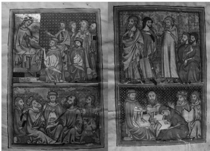
FIGURA 4 Ordenamiento de Alcalá (Escorial, Z.III.9, fols. VI r -VII r ). Pedro I ordena la revisión del ordenamiento promulgado por su padre (ca. 1352).