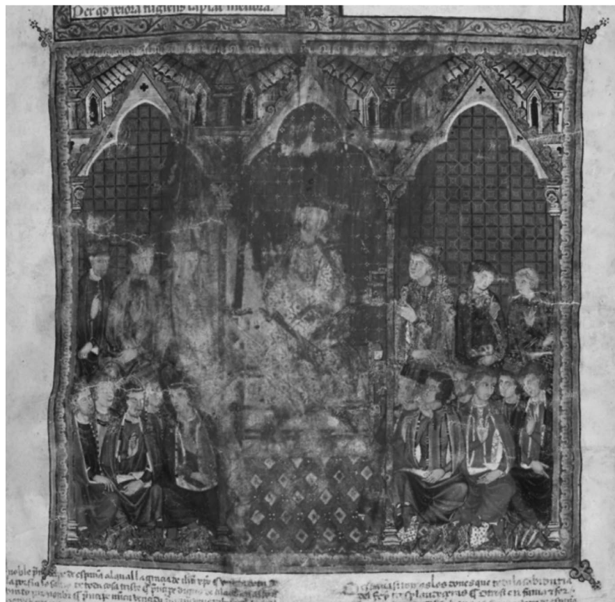
FIGURA 1 Estoria de Espanna (Escorial, Y.I.2, fol. 1 v ). Alfonso X entrega la obra al infante Fernando de la Cerda (ca. 1274).

Es precisamente de esos espectros recurrentes de los que se tratará en este artículo, puesto que, más que analizar la impronta dejada por lo alfonsí en términos de estilo o de tipologías librarias, lo que se pretende aquí es examinar las formas y las máscaras bajo las que se presenta Alfonso X en los libros confeccionados para sus herederos.