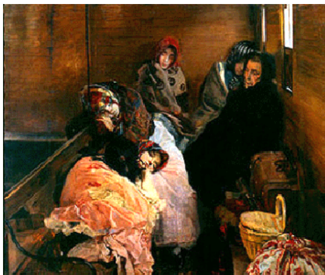
Fig. 6 Trata de blancas (1894-1895) de Joaquín Sorolla, óleo sobre lienzo (Museo Sorolla, Madrid).