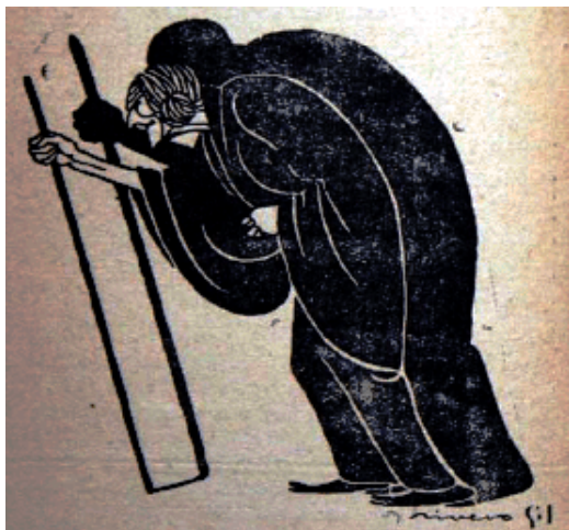
Fig. 3 Ilustración de Rivero del personaje de la Raposa en Ligazón, auto para siluetas (Madrid: La Novela Mundial, 1926), ilustración II.