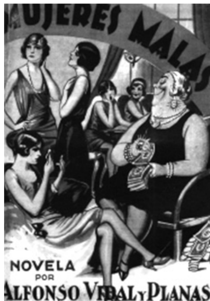
Fig. 8 Portada representando en primer término una madama, Mujeres malas de Alfonso Vidal y Planas, sin fecha pero probablemente de los años veinte de siglo xx.