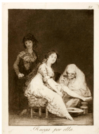
Fig. 1 Aguafuerte de Goya titulado Ruega por ella (1797-99), Museo del Prado, Madrid.