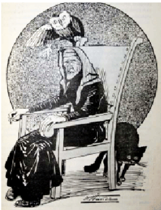
Fig. 4 Ilustración de V. Ibáñez de la saludadora en el cuento «Beatriz» (Madrid: Tip. de Juan Pérez Torres, 1913), ilustración I.