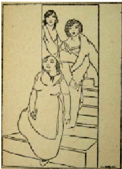
Fig. 7 Ilustración de Masberger para El terno del difunto (Madrid: La Novela Mundial, 1926), ilustración I, en que se ve a la Madre Celestina bajando las escaleras seguida por dos muchachas.